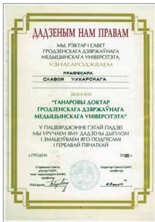
Dyplom doktora honoris causa Grodzieńskiego Państwowego Uniwersytetu Medycznego (w języku białoruskim, oprawiony w grube okładki obciążone czerwoną skórzaną powłoczką).