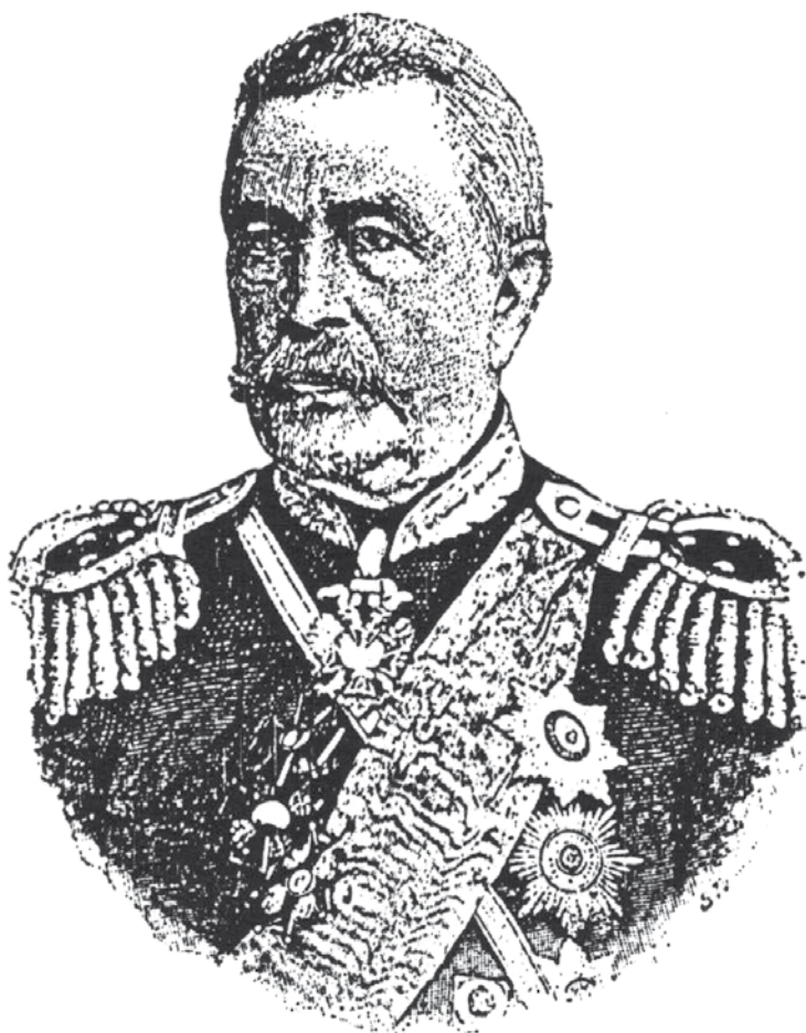
Rycina 1. Portret prof. Juliana Trappa (1814–1908) wg publikacji M. Stępowskiego: Rzut oka na dzieje farmacji w Polsce w XIX stuleciu. Warszawa 1901 s. 71.

Ten wybitny uczoney XIX wieku, farmaceuta polskiej narodowości, prof. farmacji, farmakologii i farmakologii na Akademii Medyko-Chirurgicznej w St. Petersburgu, zasługuje na przypomnienie w setną rocznicę śmierci.